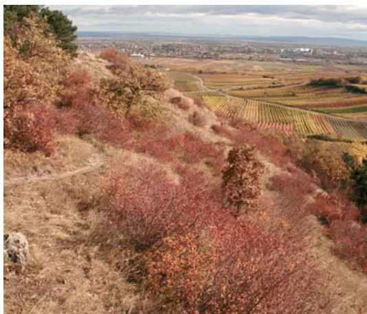
Stimmungsvolle Herbstfärbung am Heferlberg