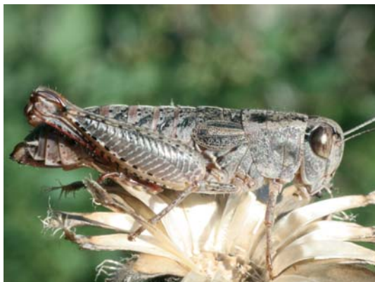
Brunners-Schönschrecke ( Paracaloptenus caloptenoides )