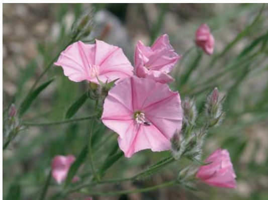
Kantabrische Winde ( Convolvulus cantabrica )