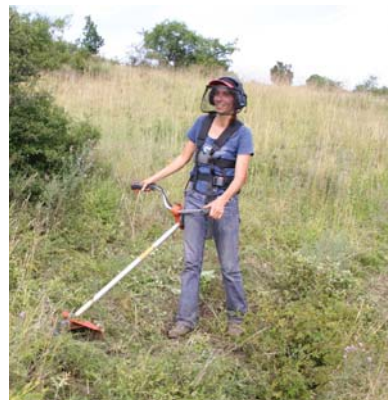
Pflege mittels Freischneider