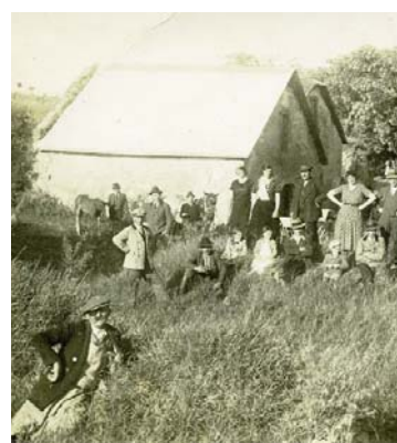
Leben in der Kellergasse