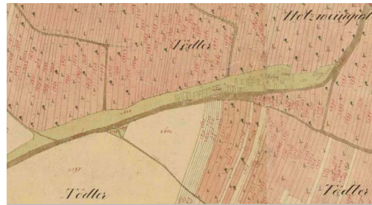
Kellergasse von Prellenkirchen