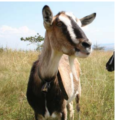
Ziegen als Landschaftspfleger

Im Rahmen des LIFE-Projektes wird in den Hainburger Bergen auch ein wissenschaftliches Beobachtungsprogramm durchgeführt, das die Einflüsse der Beweidung dokumentieren soll. Anhand von Dauerbeobachtungsflächen können die Veränderungen der Tier- und Pflanzenarten in Abhängigkeit von Beweidungsintensität und -zeitpunkt analysiert werden. Das Trockenrasen-Monitoring soll die laufende Pflege optimieren und Strategien zu einem nachhaltigen Schutz der gefährdeten Tier- und Pflanzenwelt in den Hainburger Bergen liefern.