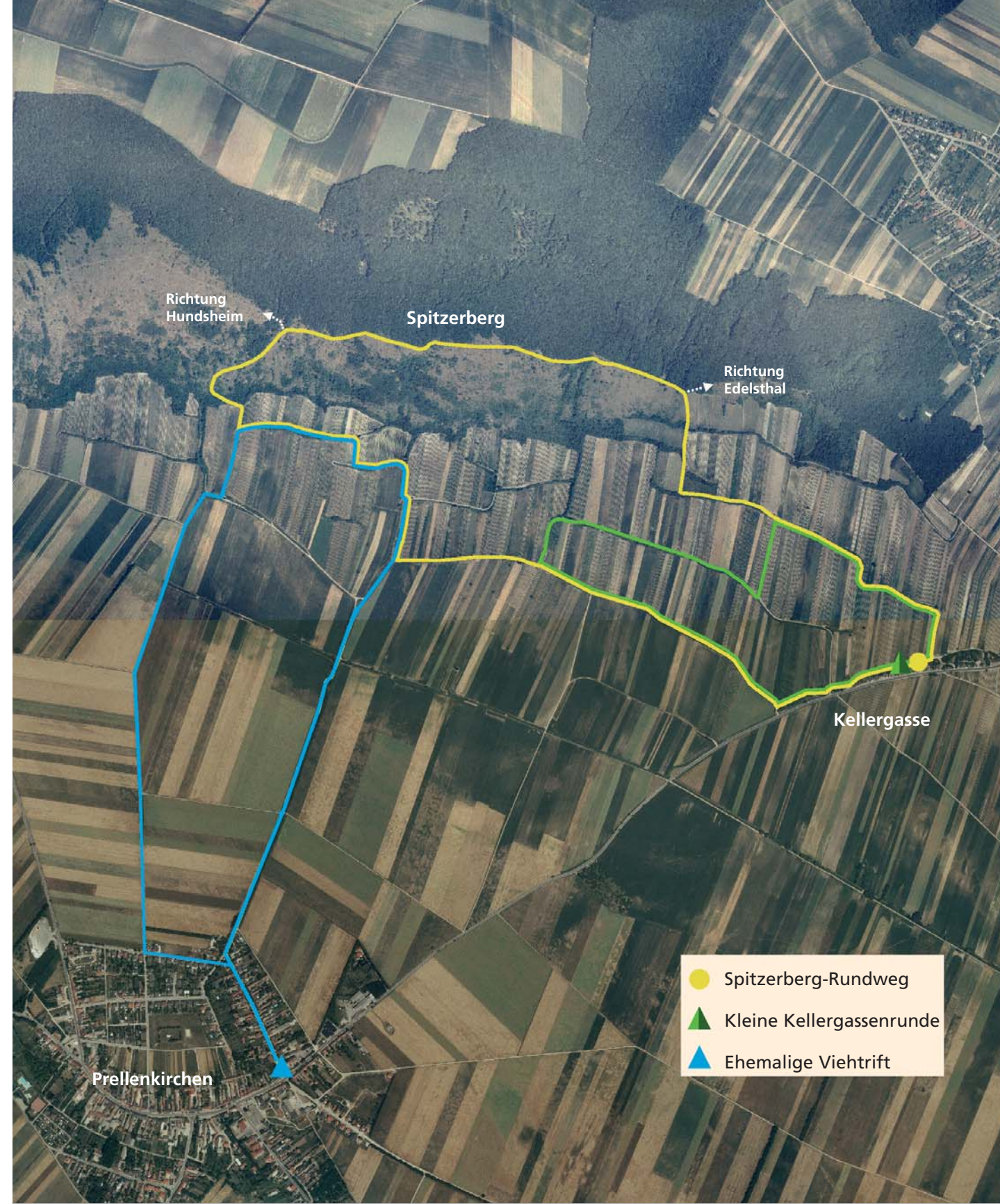
Wege am Spitzerberg