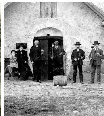
Presshaus anno dazumal