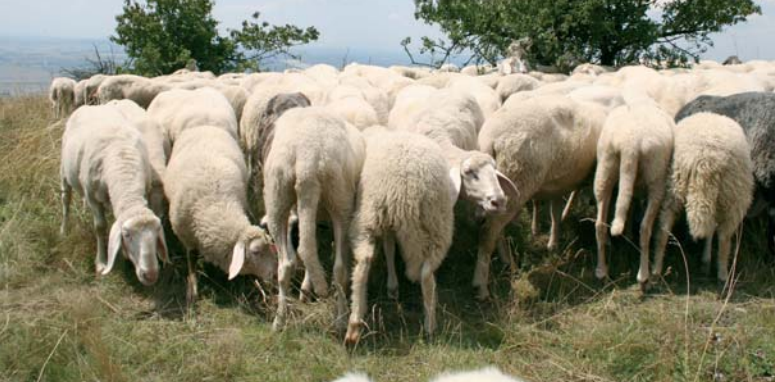
Beweidung mit Schafen