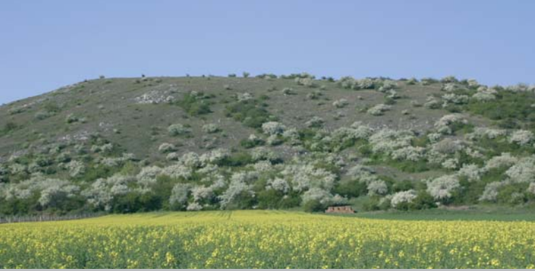
Felstrockenrasen auf Kalk prägen den Landschaftscharakter