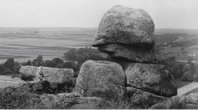
Naturdenkmal Fehhaube um 1930