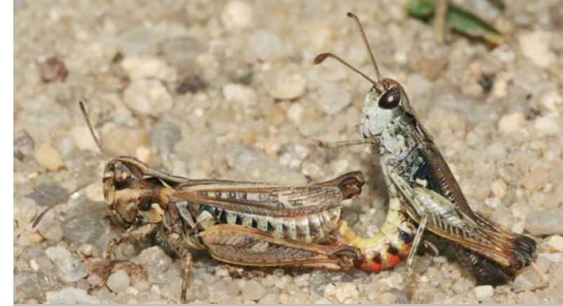
Gefleckte Keulenschrecke ( Myrmeleotettix maculatus ); Paarung