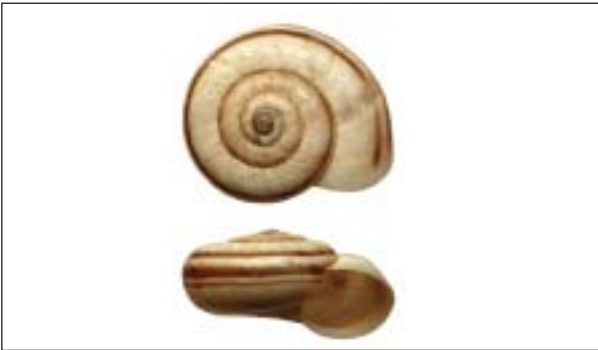
Suchomilka obecná ( Xerolenta obvia ) má plochou ulitu s výraznými tmavými proužky

stepní ( Chondrula tridens ), která také v posledních letech ubyla, ale není na tom zdaleka tak zle. Tento druh žije i na nevápnitých stepích a je schopný žít i na náhradních stanovištích (suché a pravidelně kosené náspy podél cest apod.). Je pro ni důležitá sukcesně primární povaha stanoviště – citlivá je na zarůstání. Mezi druhy tvořící páteř stepní malakofauny patří ty, jejichž hlavní podmínkou na stanoviště je jeho otevřenost. Setkáme se s nimi hojně i na jiných, často zcela umělých, otevřených stanovištích. Jedná se zejména o údolníčka drobného ( Vallonia pulchella ) a údolníčka žebnatého ( V. costata ), vrkoče malinkého ( Vertigo pygmaea ) a drobníčku válcovitou ( Truncatellina cylindrica ). Ve všech případech se jedná o drobné druhy, velikost jejich ulity nepřesahuje 3 mm. Na stepích se však setkáme i s nápadnějšími druhy plžů. Charakteristickým stepním druhem nížin je bezpochyby páskovka žíhaná ( Cepaea vindobonensis ). Proužky na ulitě má i o něco menší suchomilka obecná ( Xerolenta obvia ), jejíž ulita je výrazně plošší a s širokou píštělí (otvor na spodní straně uprostřed). Tento druh vytváří zvláště na vápníkem bohatých stepích silné populace.