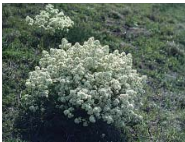
Katrán tatarský ( Crambe tataria )