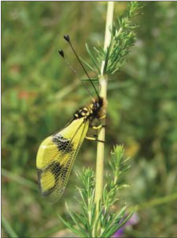
Rychle mizející ploskoroh pestrý ( Libelloides macaronius ) je hbitý letec, a ač patří mezi síťokřídlé, může připomínat vážku

druhy Ectobius erythronotus , Phyllodromica megerlei a P. maculata . Obvykle rychle pobíhají při zemi v suché vegetaci, po povrchu půdy, méně často po vyšších bylinách a keřích. Ze sedmi našich druhů škvorů patří také jeden k obyvatelům xerothermního bezlesí. Je to škvor dvouskrvný ( Anechura bipunctata ). Je dlouhý až 2,5 cm, černohnědý s červenohnědou hlavou a nohama. Uprostřed každé krovky má světlou skvrnu. Vzácně se vyskytuje např. na Pavlovských vrších a Pouzdřanské stepi.