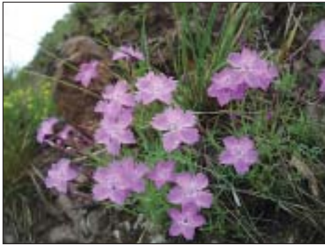
Hvozdík moravský ( Dianthus moravicus )