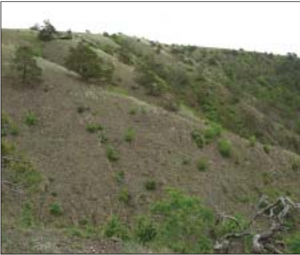
NPR Mohelenská hadcová step

k jihu, prohřívá se podstatně více než sousední světlý granolit, a hadcové lokality tedy působí teplomilněji, stepněji. Proslulou lokalitou v údolí Jihlavy je především Mohelenská hadcová step, ale výchozy hadců lze stopovat i kolem Lhánic, v okolí Templštejna, pod Biskoupkami i u Hrubšic. Vyznačují se hojností kavylů, zejména k. chlupatého ( Stipa dasyphylla ), nízkých kostřav, jen na ně je vázána trávníčka obecná hadcová ( Armeria maritima subsp. serpentina ), u Mohelna roste na nejsevernějším místě i mediteránní podmrška Marantova ( Notholana marantae ). Hadcové lokality patří rovněž k nejvýznamnějším lokalitám teplomilného hmyzu. V minulosti se tyto stepi vypásaly, dnes je problémem sukcese křovin, na samotném Mohelně i dřevin, mimo jiné severoamerické borovice Banksovy ( Pinus banksiana ).