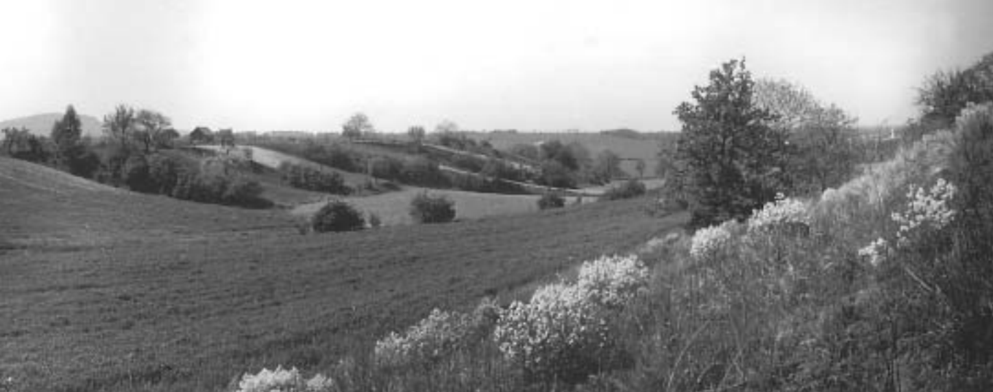
Porosty stepního běžce katránu tatarského ( Crambe tatarica ) na Pouzdřanské stepi obdivovali a obdivují nejen botanici, ale i básníci

republice je takový ráz krajiny výjimečný, vždyť do severopanonské biogeografické podprovincie náleží pouhá 4 % státního území, a to pouze v jižní polovině Moravy. Fytogeografové řadí toto území do oblasti teplomilné květeny (termofytika), a to do fytogeografického obvodu Panonské termofytikum.