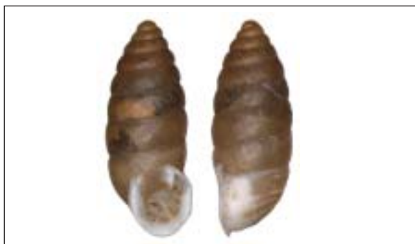
Charakteristickým druhem plžů stepních stanovišť na vápnitém podloží je žitovka obilná ( Granaria frumentum )