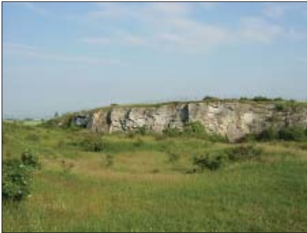
NPP Stránská skála v těsném sousedství Brna je pozoruhodná nejen svou flórou a faunou, ale i archeologickými nálezy

caerulea ) a zajímavá vegetace vápencových skal. Vzhledem k tomu, že Stránská skála je dnes obklopena urbánní krajinou, je území celoročně hojně navštěvováno a místy dochází k sešlapávání vzácných společenstev.