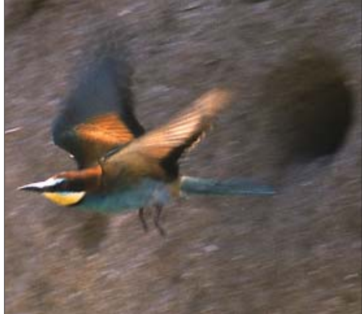
Vlha pestrá ( Merops apiaster ) hnízdí v norách sprašových a písčných stěn

kem nebo shromažďováním zásob. Z obojživelníků do těchto biotopů pravidelně proniká pouze ropucha zelená ( Bufo viridis ), ale její rozmnožování probíhá jinde. Z plazů zde žijí ještěrka zelená ( Lacerta viridis ) a užovka hladká ( Coronella austriaca ), i když oba tyto druhy mají širší stanovištní valenci a zvláště druhý z nich má u nás mnohem větší rozšíření a obývá i jiná prostředí.