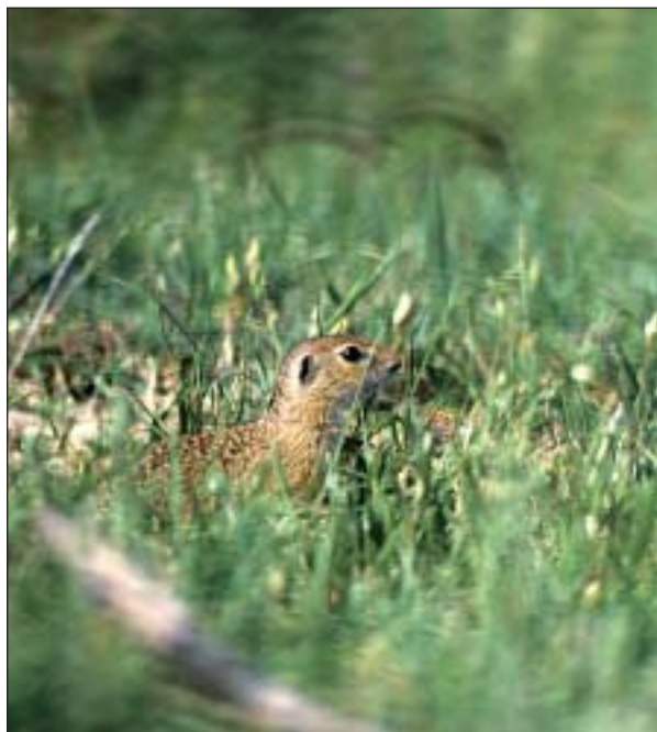
Sysel obecný ( Citellus citellus )

Hranice palearktického stepního eremiálu dosahuje na západ jen k deltě Dunaje a celý panonský distrikt je od něho oddělen Karpaty. Patrně tedy pozdní vznik pastevní stepi a izolace ve vnitrokarpatské kotlině vedly k tomu, že zdejší stepní fauna je ochuzená a postrádá různé typické stepní druhy žijící dodnes nebo původně již v jihokrajinských stepích. Ze savců je to frček Allactaga jaculus , svišť Marmota baibacina nebo sajga Saiga tatarica . Rozšíření slepce Spalax leucodon zůstalo omezeno na Velkou uherskou nížinu, rozšíření myšivky Sicista subtilis zasahuje do Malé uherské nížiny. Dále na západ až do Rakouska a Čech se rozšířil tchoř stepní ( Mustela eversmanni ), sysel obecný ( Spermophilus citellus ) a křeček polní ( Cricetus cricetus ). Zejména poslední se stal známým obyvatelem polí až do západní Evropy. Na Panonii je také omezena myš obilná ( Mus spicilegus ), která se však patrně rozšířila v důsledku adaptace na kulturní zemědělskou krajinu. Podobně