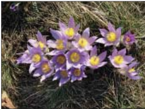
Koniklec velkokvětý ( Pulsatilla grandis )