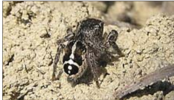
Pavouk skákavka křížová ( Pellenes tripunctatus ) preferuje velmi suché a teplé skalní stepi

Kolem 30 z více než 850 druhů pavouků známých z území České republiky je svým výskytem omezeno na jihomoravská stepní lada a skalní stepi. Zvláště na skalních stepích můžeme najít více, často vzácných a stanovištně úzce specializovaných druhů. Jsou to např. šestiočka stepní ( Dysdera ninnii ), snovačka líbezná ( Neottiura suaveolens ), plachetnatka suchopárová