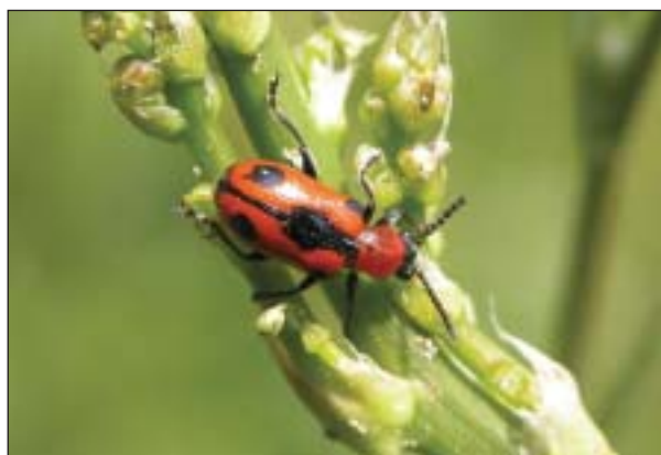
Na chřestu lékařském ( Asparagus officinalis ) narazíme místy na početný výskyt chřestovníčků Crioceris quinquepunctata