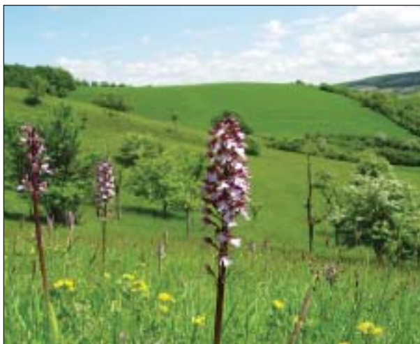
Jako žezla králů trčí ze stepních trávníků PR Malhotky nádherná květenství teplomilného vstavače nachového ( Orchis purpurea )

Vydání 17. zvláštního čísla časopisu Veronica umožnily prostředky poskytnuté zemskou vládou Dolního Rakouska v rámci projektu zaměřeného na ochranu, propagaci a trvale udržitelný vývoj panonských stepí a suchých trávníků, který je součástí programu Evropské unie LIFE-Nature. V současnosti je projekt LIFE-Nature aplikován v Dolním Rakousku, kde by měl rozvíjet a trvale zajistit poslední zbytky panonských stepí. Publikace o těchto ojedinělých lokalitách budou rovněž vydány v Maďarsku a na Slovensku. Cílem je bližší spolupráce v oblasti ochrany přírody a také zintenzivnění výměny informací, jelikož ochrana přírody nezná hranic a je obecnou věcí zájmu všech národů.