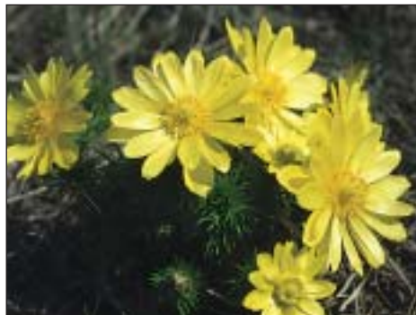
Hlaváček jarní ( Adonis vernalis )