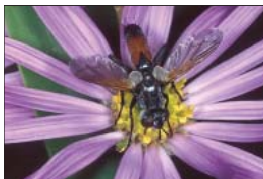
Kuklice Cylindromyia brassicaria , která se vyvíjí v plošticích z čeledi kněžicovitých