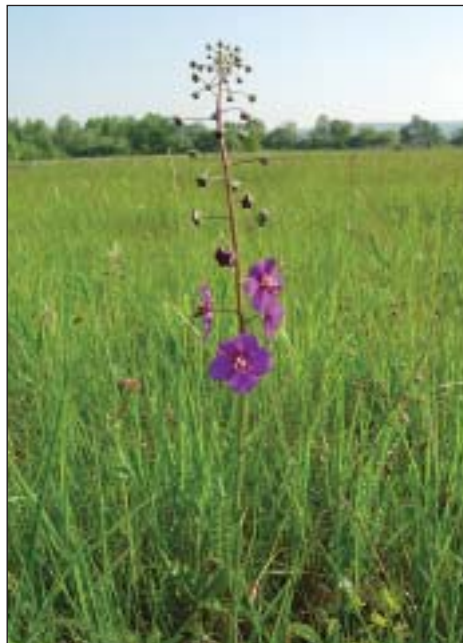
Divizna brunátná ( Verbascum phoeniceum )

Stepní běžec katrán je velmi nápadnou, takříkajíc vlajkovou rostlinou jihomoravských stepí. Dosahuje zde absolutní hranice rozšíření směrem k severozápadu, ale pozoruhodné je, že v sousedních zemích (v Rakousku,