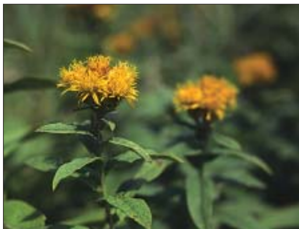
Oman německý ( Inula germanica )