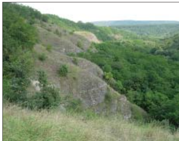
Druhově velmi bohatá a výjimečná je skalní step na slepencích u Moravského Krumlova

Pálava má z hlediska jihomoravské stepní bioty zvláštní postavení. Je jediným územím, kde se na větší rozloze objevuje panonská skalní step na vápencovém podkladě – podobné typy biotopů najdeme např. na Hainburských kopcích v Rakousku, na okrajích Malých Karpat na Slovensku a na řadě míst v severním Maďarsku. Svérázná geologie, spojená navíc s dramatickou geomorfologií bradla, klimatické zvláštnosti – to vše předurčuje svéráznou flóru a faunu. Na Pálavě je velmi úzký kontakt lesa a bezlesí. I když je zřejmé, že řada dnes odlesněných ploch byla v minulosti lesem, mnohde byl tento les velmi řídký a zřejmě měl spíše charakter řídkého porostu s četnými bezlesými enklávami. Bezlesé byly samozřejmě bezprostřední okraje skal – zde nepo-