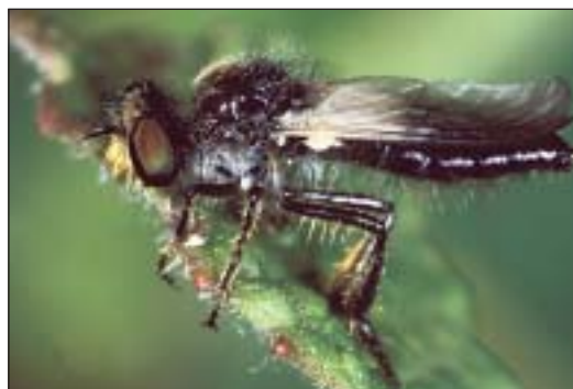
Na stepních stanovištích žije typický roupec xerotermních lokalit Hologogon nigripennis