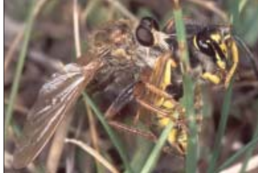
Teplomilný roupec Stenopogon sabaudus s ulovenou vosou

Nedílnou součástí stepní fauny jsou četné druhy velmi početného řádu blanokřídlí (Hymenoptera) – prozatím je