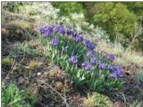
Kosatec nízký ( Iris pumila )

na Slovensku i v Maďarsku) je podstatně vzácnější než právě na jižní Moravě. I v současné době se zde vyskytuje na více než 10 nalezištích. Katrán je modelovým příkladem i z další příčiny – dokáže jako správná stepní rostlina rychle reagovat a obsadit nově vzniklé plochy. Dokazuje, že stepní druhy mají velice často v sobě skrytý potenciál dynamiky šíření.