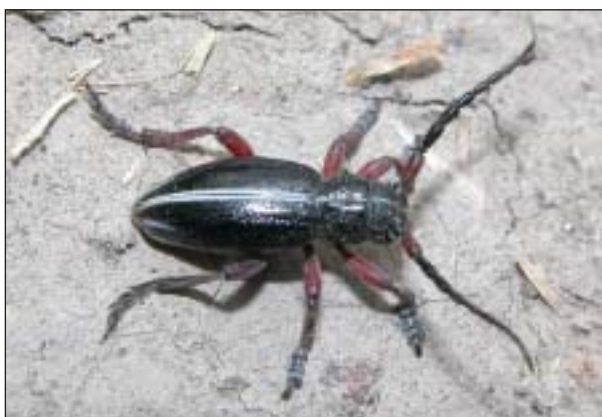
Kozlíček písečný ( Dorcadion pedestre ) se vyskytuje na plochách s nezapojenou nízkou vegetací a není schopen letu

Z přibližně 6 100 druhů brouků známých z území České republiky má těsnou vazbu k panonským stepím několik stovek druhů. Mezi zdejšími druhy najdeme jak predátory, tak fytofágy vyvíjející se na podzemních i nadzemních částech rostlin. Z velkých druhů střevlíků patří bezesporu k nejvýznamnějším zavalitý, černě zbarvený, jenom slabě lesklý střevlík uherský ( Carabus hungaricus ). Na holých písčitých půdách s řídkou vegetací se místy vyskytuje zelený, měděně lesklý svižník Cicindela soluta . Vzácný střevlíček lunoskvrnný ( Callistus lunatus ) obývá stepní stanoviště, ale také opuštěné lomy a suché okraje lesů. Černě zbarvený, plochý střevlíček Licinus cassideus je specializovaný predátor plžů a k tomu má dokonale přizpůsobené ústní ústrojí umožňující pronikat do jejich ulit. Na stepních místech, ale také na slaniscích se vzácně objevuje droboučký, jen asi 3,5 mm dlouhý, černě zbarvený střevlíček Amblystomus niger . Na suchých biotopech s písčitým nebo vápencovým podkladem se vzácně setkáme se střevlíčkem Masoreus wetterhallii . Až 11 mm dlouhý, kovově modrý střevlíček Cymindis miliaris preferuje skalní stepi.