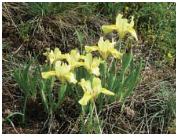
Kosatec skalní písečný ( Iris humilis subsp. arenaria ) – foto P. Halas

Předcházejícímu typu fyziognomicky podobná, ale v druhové skladbě značně odlišná je vegetace svazu Koelerio-Phleion phleoidis , vázaná na kyselé substráty a typicky vyvinutá na nejvýchodnějších okrajích Českého masivu. Na rozdíl od předcházející ji tvoří směs druhů acidotolerantních i výrazně acidofilních. K těm prvním patří např. kostřava žlábkatá ( Festuca rupicola ), ostřice nízká ( Carex humilis ), mařinka psí ( Asperula cynanchica ), rozrazil klasnatý ( Pseudolysimachion spicatum ), z acidofilních druhů se v tomto typu vegetace vyskytuje např. kostřava ovčí ( Festuca ovina ), smolníčka obecná ( Lychnis viscaria ), šťovík menší ( Rumex acetosella ).