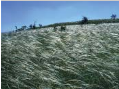
Kavyl chlupatý ( Stipa dasyphylla )