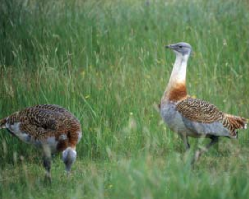
Drop velký ( Otis tarda ), který se kdysi rozšířil i do kulturní stepi, z jižní Moravy už prakticky vymizel