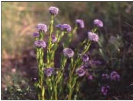
Koulenka prodloužená ( Globularia bisnagari-ca )