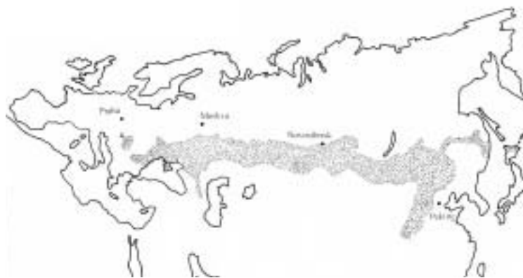
Rozšíření stepní a lesostepní krajiny v Euroasii (podle A. G. Isačenka a A. A. Šljapnikova 1989)

A - odloučený ostrov Panonie, k němuž patří i jižní Morava