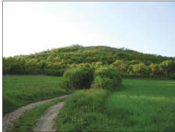
V převážně zemědělské polní krajině jihovýchodně od Brna je ojedinělou lokalitou stepní flóry a fauny PR Špice

Blízkost Brna je jistě jedním z důvodů, proč o Staré hoře nedaleko Újezda u Brna (starší badatelé důsledně uváděli u Sokolnic) existuje tolik historických údajů. Lokalita je to ovšem i dnes parádní – jde zřejmě o nejsevernější naleziště katránu tatarského ( Crambe tataria ), roste zde kosatec nízký ( Iris pumila ), mnoho druhů záraz, jednu ze 2 lokalit v České republice zde má statný pryšec vrbolistý ( Euphorbia salicifolia ). Zvláštností je také výskyt šateru svazčitého ( Gypsophila fastigiata ), který se jinak vyskytuje prakticky jen na píscích. Jde o jižně orientovaný svah, odedávna asi využitý jako mozaika pastvin, kosených ploch, sadů, vinohradů a drobných políček. I nyní zde můžeme spatřit bohatý soubor druhů, i když je paradox, že některé z těch nejvýznamnějších se dodnes vyskytují jen mimo plochu s územní ochra-