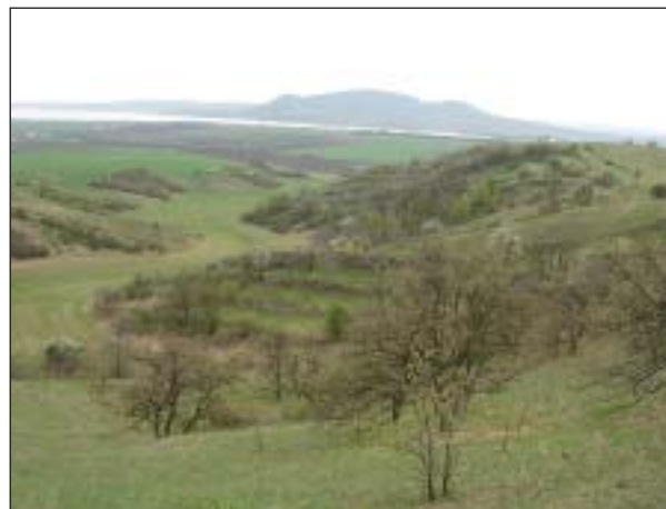
Jihomoravská krajina s NPR Pouzďřanská step-Kolby s Pavlovskými vrchy na obzoru

Jedna z nejproslulejších lokalit teplomilné stepní vegetace se rozkládá na svazích kopce Strážná nad Pouzďřany. Převažujícím vegetačním typem je zde souvislý porost kavylu sličného ( Stipa pulcherrima ), v němž je dosti hojný katrán tatarský ( Crambe tataria ). Jádro Pouzďřanské stepi je zřejmě primárním bezlesím, které však bylo v minulosti po vykácení přiléhajících teplomilných doubrav rozšířeno na dnešní plochu. Do poloviny 20. století se zde páslo a na ploše byly vysázeny ovocné stromy, réva a kultury lékořice, na horním okraji byla tradičně pole. Významným faktorem, který lokalitu dlouho ovlivňoval, byly požáry, a také pulsující kolonie divokých králíků. Lokalita proslula díky snadné dostupnosti mezi brněnskými přírodovědci, takže odtud existují desítky botanických i entomologických záznamů. Z botanického pohledu se zdá, že ke kvalitativním změnám