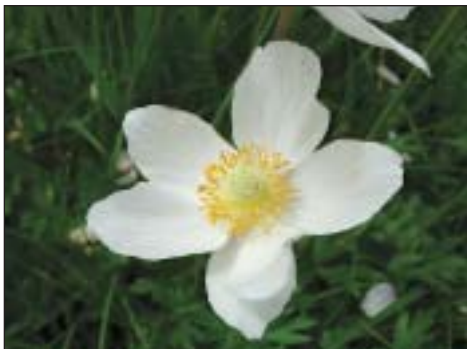
Sasanka lesní ( Anemone sylvestris )