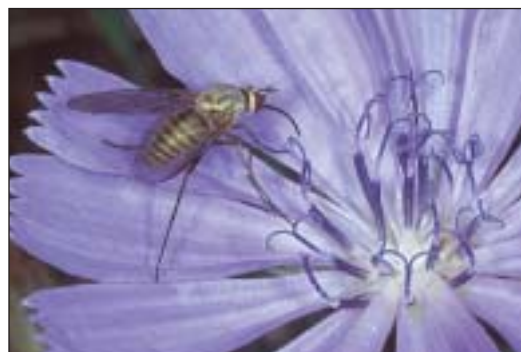
Submediteránní dlouhososka Phthiria gaedei (nyní oddělována do samostatné čeledi Phthiriidae), která je typická pro jihomoravské stepní stráně