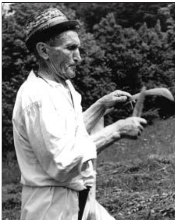
Rázovitá postava z Horňácka

čí překosení nebo přepasení jednou za několik let. Po seči se seno vyhrabe a odstraní mimo plochu. Mimochodem i zdánlivě banální hrabání sena má v údržbě teplomilných společenstev svůj význam – pomáhá rozvolnit travní drn a vytváří tak prostor pro diaspory řady cenných druhů bylin. Co se s travní hmotou děje v případě pastvy je nasnadě. Pastvu dnes považujeme za optimální způsob údržby většiny typů stepních trávníků. Bohužel po dlouhé době absence pastvy se znovu teprve učíme jak na to. Pastvu lze totiž do značné míry přirovnat k loterii, jejíž výsledek se může rok od roku lišit, protože závisí na celé řadě faktorů, z nichž ten nejméně předvídatelný, totiž průběh počasí, je nejdůležitější. Nesporné výhody extenzivní pastvy spočívají v možnosti její průběžné regulace. V závislosti na počasí a stavu porostu můžeme měnit počet zvířat, složení stáda, místo a čas pastvy. K dalším výhodám patří selektivita. Zejména ovce upřednostňují měkčí, nekvetoucí trávy, nízké keříky, zatímco kozy jsou ve výběru potravy zaměřené spíše do vyšších pater na větve a listí vyšších