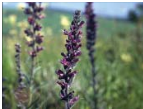
Hadinec červený ( Echium maculatum )