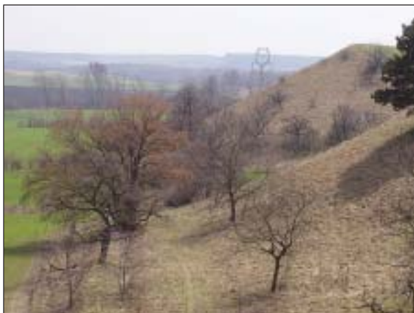
PR Špidláky u Čejče – další „ostrov pokladů“ v polní krajině

Luka) na kobylském katastru narušilo vybudování úzkých teras; přesto i tam se ještě v 90. letech vyskytovaly tak citlivé druhy, jako vstavač osmahlý ( Orchis ustulata ) nebo lýkovec vonný ( Daphne cneorum ), o typických stepních druzích ani nemluvě. Teprve nedávný průzkum zde prokázal existenci na dlouhá léta ztracené populace pelyňku Pančícova ( Artemisia panicii ). Komplex lokalit mezi Čejčí a Čejkovicemi stále patří k nejvýznamnějším stepním lokalitám České republiky, setkáme se zde s řadou druhů, které třeba chybějí na nedaleké (a docela podobné) stepi Pouzdřanské.