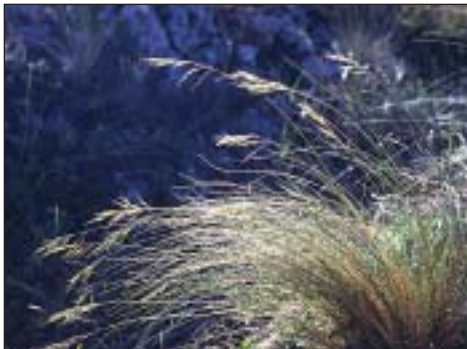
Ovsíř stepní ( Helictotrichon desertorum )