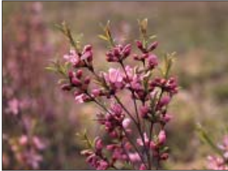
Mandloň nízká ( Prunus tenella )