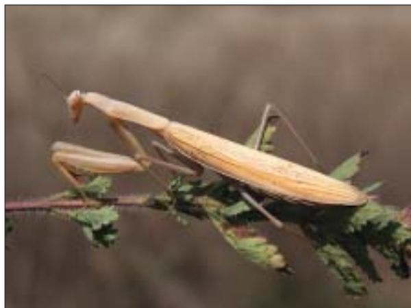
Nápadná kudlanka nábožná ( Mantis religiosa ) je dnes na xerothermních stanovištích jižní Moravy běžným druhem

druhý je znám pouze z Pálavy. Na místech s vyšší vegetací zaslechneme koncem léta navečer a v noci charakteristický melodický zpěv cvrčivce révového ( Oecanthus pellucens ). Cvrčivec je sice dlouhý jen kolem 1,5 cm, ale jeho zpěv je slyšitelný desítky metrů. Zbarven je okrově žlutě, lesklá průhledná křídla skládá ploše na zadečku.